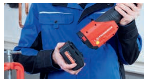
RO "tehnologie fără fir": O baterie pentru întreaga aplicație