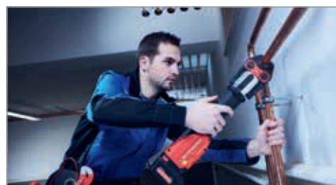
Operare confortabilă cu ROMAX 4000